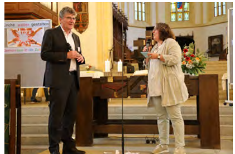
Sybille Kalmbach im Interview mit Landesbischof Ernst-Wilhelm Gohl

Als Gast zu unserem Forum Kirche weiter gestalten durften wir Landesbischof Ernst-Wilhelm Gohl begrüßen. Er hat mit uns seine Sicht zur momentanen Lage unserer Kirche und zu möglichen Zukunftsperspektiven geteilt.