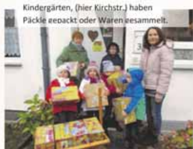
Kindergärten, (hier Kirchstr.) haben Päckle gepackt oder Waren gesammelt.

Wir von den Sammelstellen können nur staunen. Trotz der vielen Möglichkeiten zu helfen, haben Sie sich für „Ein Päckchen Liebe schenken“ entschieden. Wir danken von Herzen ALLEN Gärtringern, auch im Namen des Missionsbundes Licht im Osten für die Abgabe der vielen Waren, für die vielen Ideen in den 350 Päckchen, für die gespendeten 950,- € und die vielen Gebete. Gott beschenke und segne Sie reich.