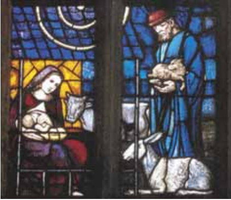
Weihnachtsmotiv in der St- Veit-Kirche