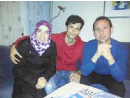
Flüchtlinge bei ihrer Ankunft in ihrer neuen Bleibe bei einem Gemeindeglied

Beispielhaft vorangegangen ist an dieser Stelle ein Gemeindeglied, das eine schwangere Frau und ihren Mann bei sich aufgenommen hat und mit ihnen die Wohnung teilt. „Leben teilen“ hat er das Projekt genannt. Sein Beispiel könnte Schule machen.