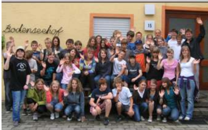
Konfirmandenfreizeit am Bodenseehof